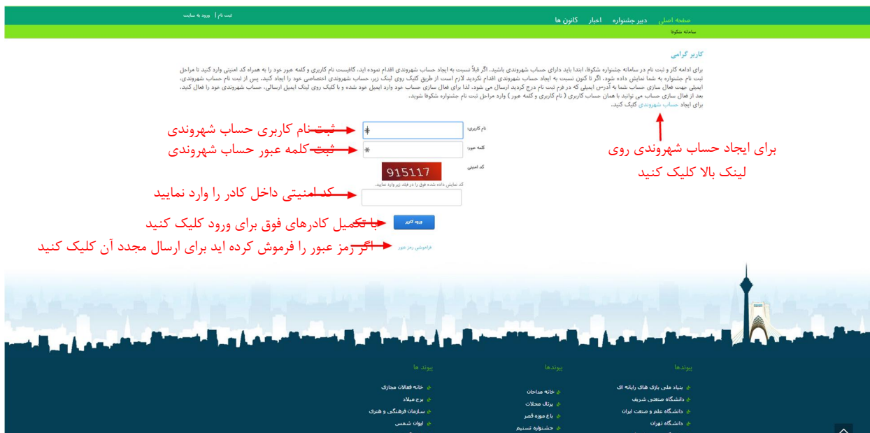
تصویر ۲: صفحه ورود به سامانه جشنواره شکوفا