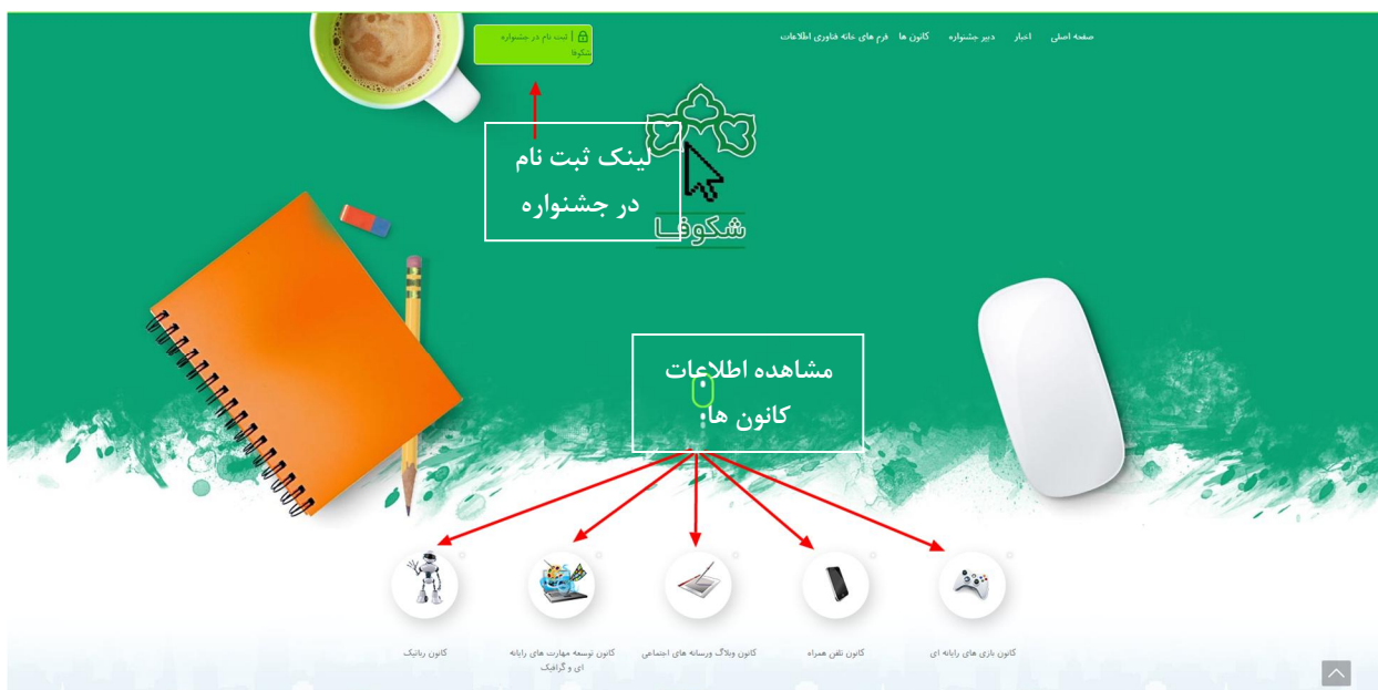
تصویر ۱ : صفحه اصلی پرتال شکوفا